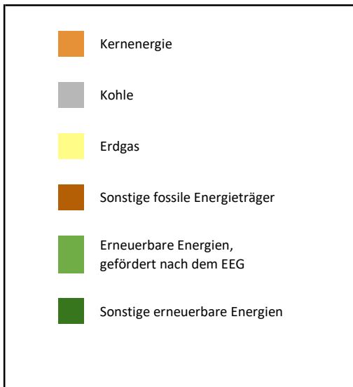
Zum Vergleich Stromerzeugung in Deutschland