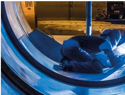
WIG-Schweißen hochlegierter Stähle