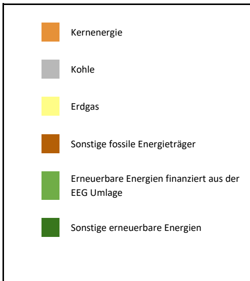
Zum Vergleich Stromerzeugung in Deutschland